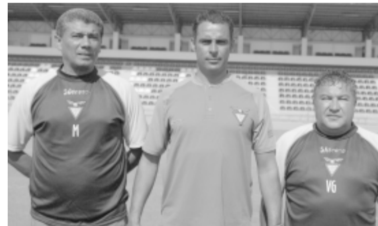
NA IMAGEM: DFDFDFDFDFSF

Por fim, o Desportivo das Aves termina o campeonato no seu reduto com a equipa do Penafiel. Com o fim da competição no estádio do Desportivo das Aves esperemos que seja um bom prenúncio de festa como ocorreu na época em que a equipa subiu a Primeira Liga. Fez a festa em Vila das Aves. ■■■