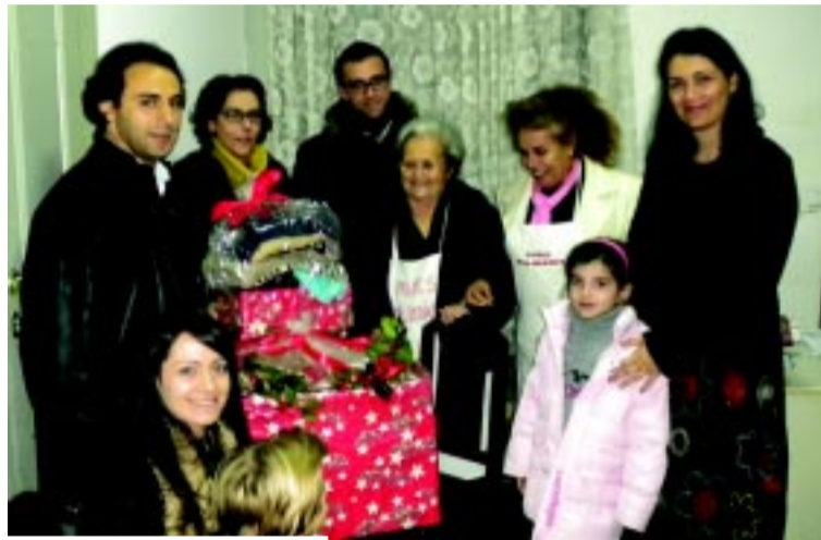
A ENTREGA DE CABAZES DE NATAL NA ASSOCIAÇÃO AVES SOLIDÁRIA

Praça do Bom Nome, nº 167 4795 - 025 Vila das Aves telf. 252 941 703